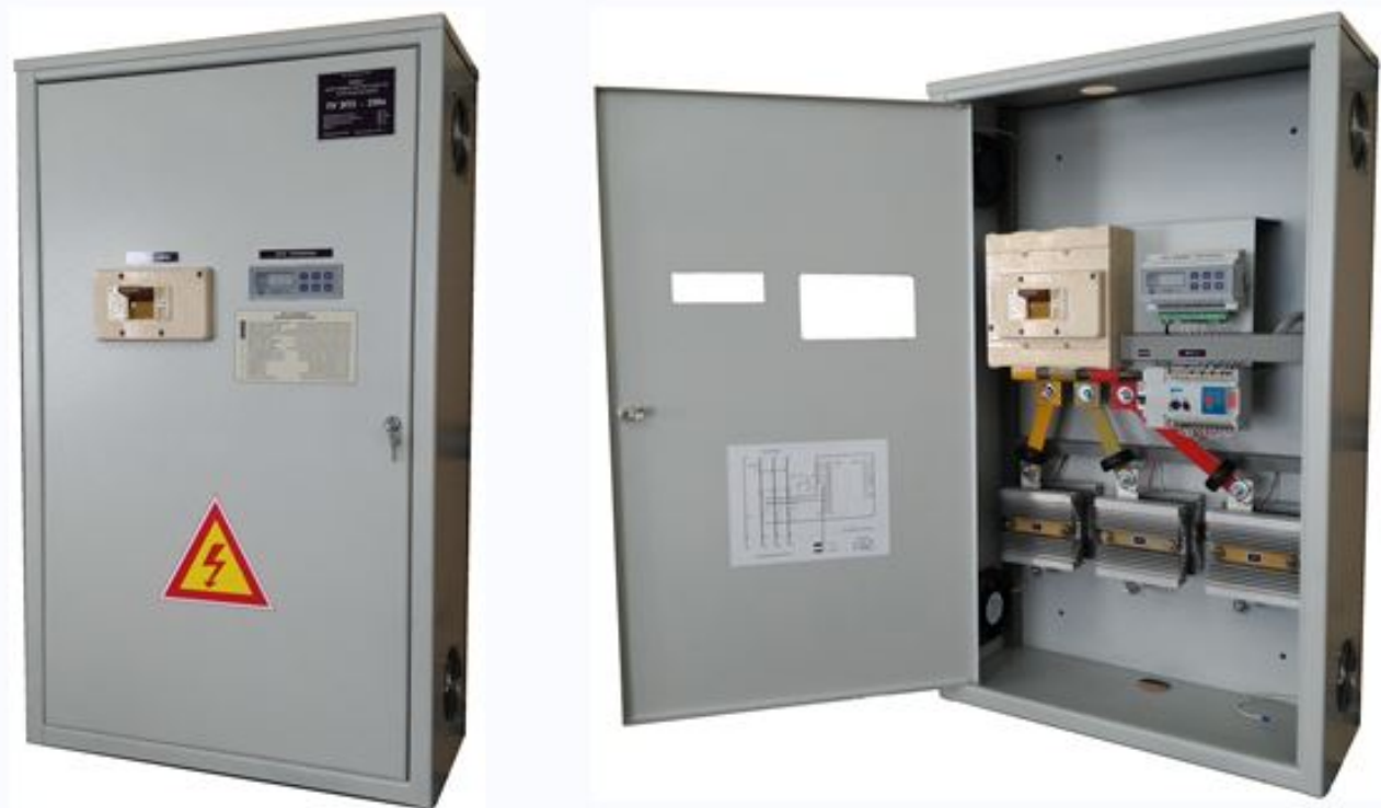
Рис. 1. Пульт управления ПУ ЭПЗ-250s